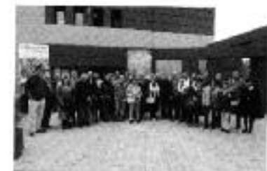
Títol: JANA Trobades Culturals Pirinenques a la Gran Sala de l'Escaldes-Engordany.