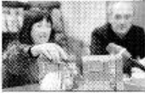
En l'acte d'obertura de la Trobada Cultural Pirinenca.

El 19 d'octubre de 2012... Obertura de la Trobada Cultural Pirinenca