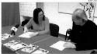
En l'acte d'obertura de la Trobada Cultural Pirinenca.