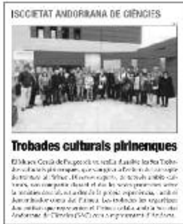
PREMSA DIGITAL DBERGUEDÀ 18/10/2012